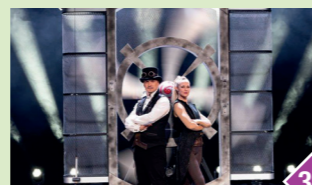
Théâtre de Panoramix Laissez-vous embarquer dans un monde de grandes illusions à couper le souffle.